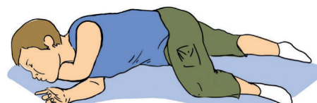
Устойчивое боковое положение